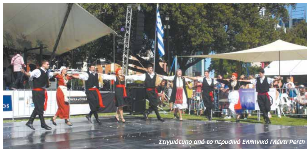
Στιγμιότυπο από το περσινο Ελληνικό Γλέντι Perth

Πολλά περισσότερες πληροφορίες για τις εκδηλώσεις της Κοινότητας, στην ιστοσελίδα: www.perthglendi.com.au